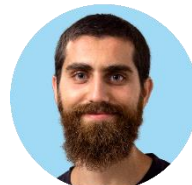
Correzione del testo ITA, invio Marco Fulgaro > RMG