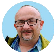
Produzione, contenuto P. Pavel Ženíšek, SDB > RMG