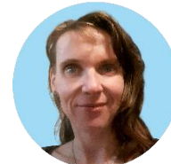
Disegno grafico, layout Martina Mončeková > Praga, Cechia